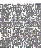
Imagen original del complemento de certificación del SAT [80FE510-21B0-4C48-A59E-A3FAD0C6CB7A]2022-05-30T11:12:59[CVD110412TF6jPzbbhDj+DujkF0ife/PmAZXoETFe8KpvWQ3b2gL9p24GW4jSi+8beAmRJMz11QpPW+63DM3 gOZRZziR5BQwpl+ahow8701vn0MyI7VIEBMUnra8bASODetlohouz4eZiZn7EeLAGimn5XtCFvosh1qau3QWZK/110QNG7DH3E+yhYYKrl.dxyin2Fh+2QxJF8J4JBFFSDp25PKXbhr/G UkykHbDhM10HnLk03BY3Da+0AM3S1nWPSht6+nU3u+vYjy7pOg9np1bUKjpTfgblmBomuTo1v+UFzvlW0U0/boplYobUzlydNCVe03xAzNv5CBBp10VmpaH+Ods/+Q==]000010000005 04441]]

Método de pago: PUE - Pago en una sola exhibición Forma de Pago: 28 - Tarjeta de débito Condiciones de Pago: